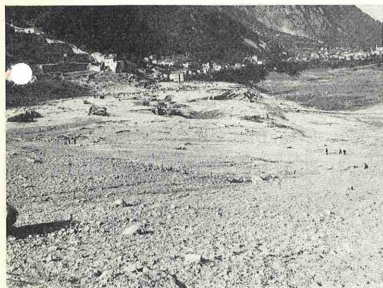
Longarone 10 ottobre 1963